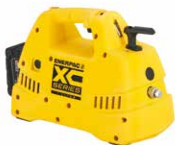
Pompe idrauliche senza cavi serie XC XC1201ME con valvola manuale