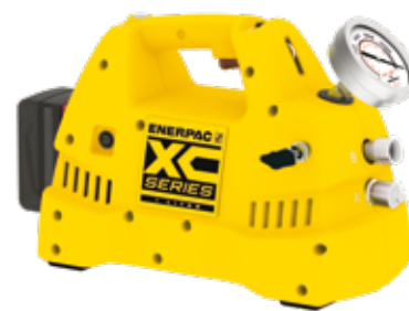
Pompe idrauliche senza cavi serie XC XC1502TE con telecomando (telecomando non raffigurato)

9619 IT © Enerpac 09-2018. Soggetto a modifiche senza preavviso.