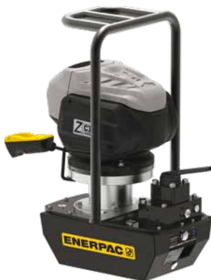
Pompe idrauliche senza cavi serie ZC ZC3308E con valvola manuale