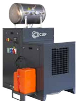
MACCHINE MULTIENERGY MULTIENERGY MACHINES

Professionalism and expertise lead us to gain almost twenty years of experience in the field of customizing work vehicles. With a focus on hydraulic, electric and air power modules, our solutions are now able to achieve utmost efficiency in performance. By ensuring power and control of the energy supplied, the solutions offered guarantee 100% reliability and operational safety.