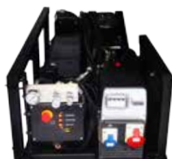
IMPIANTO MULTIUTILITY COLLEGATA A PTO MULTI-UTILITY SYSTEM PTO DRIVEN